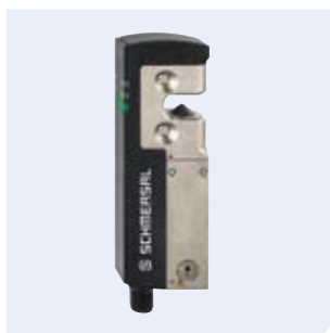
AZM 40 Dispositivo de bloqueo de seguridad por solenoide