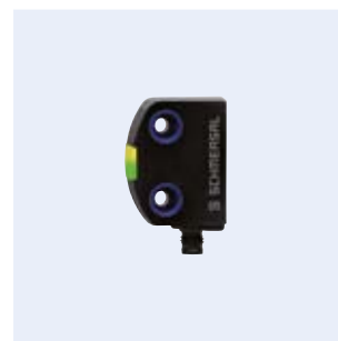
RSS260 Sensor de seguridad