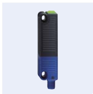
RSS36 Sensor de seguridad