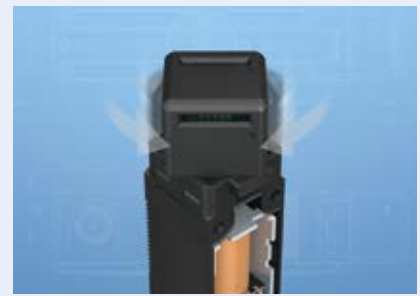
回転するアクチュエータヘッド ネジを緩めることなく回転させることが可能