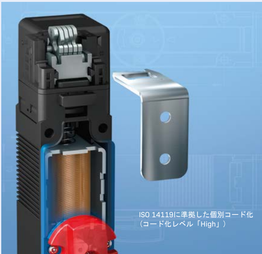
ISO 14119に準拠した個別コード化 (コード化レベル「High」)