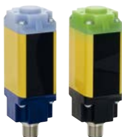
SLB 440 (类型 4)