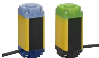
SLB 240 (类型 2)