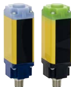
SLB 440 (类型 4)